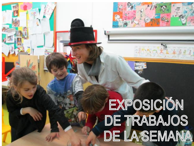
EXPOSICIÓN DE TRABAJOS DE LA SEMANA

Durante la fiesta las chaquetas y ropa de recambio estarán en la zona habilitada como GUARDARROPA