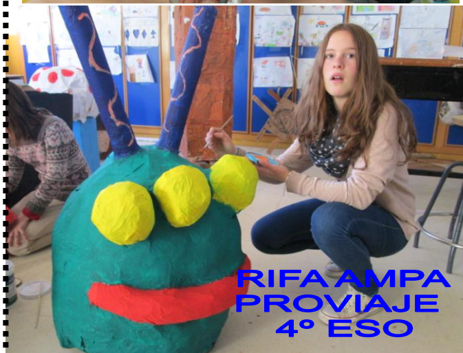
RIFA AMPA PROVIAJE 4º ESO

VENTA DE PRODUCTOS ELABORADOS POR LA COOPERATIVA DE 2º DE LA ESO